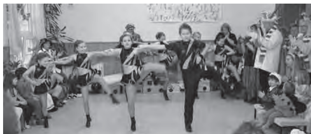
Die Schautanz-Sportgruppe des TuS Dollendorf zeigt ihr Können.

Seit August 2011 werden drei Kita-Gruppen in den Räumen des Probsthofs betreut: Kinder unter drei Jahren in der Mäusegruppe, Kinder über drei Jahren in der integrativen Froschgruppe und der Regelgruppe (Hamstergruppe), dem ehemaligen Dollendorfer Kindergarten unserer Kirchengemeinde. Ab August 2012 wird eine weitere integrative Gruppe mit 15 Plätzen zur Verfügung stehen, für die zum Redaktionsschluss dieser Ausgabe des Gemeindebriefes noch fünf Plätze für Kinder mit Beeinträchtigungen frei