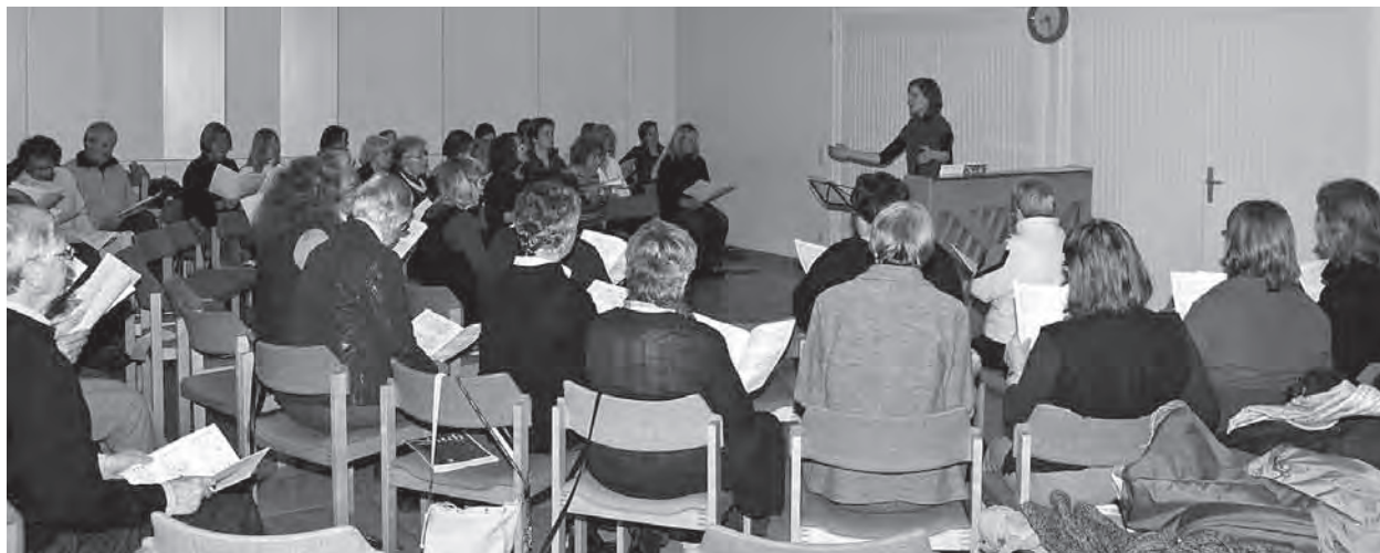
Der Singkreis bei einer Probe

Der Singkreis pflegt schon seit 26 Jahren eine tiefe Freundschaft zur Kantorei der St. Stephanus-Gemeinde in Dresden-Kleinzschachwitz. Im letzten Jahr wurde in Oberkassel das „Silberjubiläum“ der Partnerschaft gefeiert und in einem Gottesdienst die Kantate „Die Liebe Gottes ist ausgegossen“ von Johann Ernst Bach aufgeführt. Dieses Stück soll nun dieses Jahr wiederholt und am Pfingstsonntag in Dresden in der St. Stephanus-Gemeinde gesungen werden. Vom 26. bis 28.05. fährt der Singkreis nach Kleinzschachwitz. Mitte November ist zur Vorbereitung unseres Konzertes Ende November ein Freizeitwochenende des Singkreises in Kleve vorgesehen. Dies dient auch dem menschlichen Miteinander und Kennenlernen. Außerdem eignet es sich um ein paar lustige, lockere Stücke zum „Einfach-so-singen“ zu lernen, sich intensiver auf die Stimmbildung zu konzentrieren und das a cappella-Singen zu trainieren.