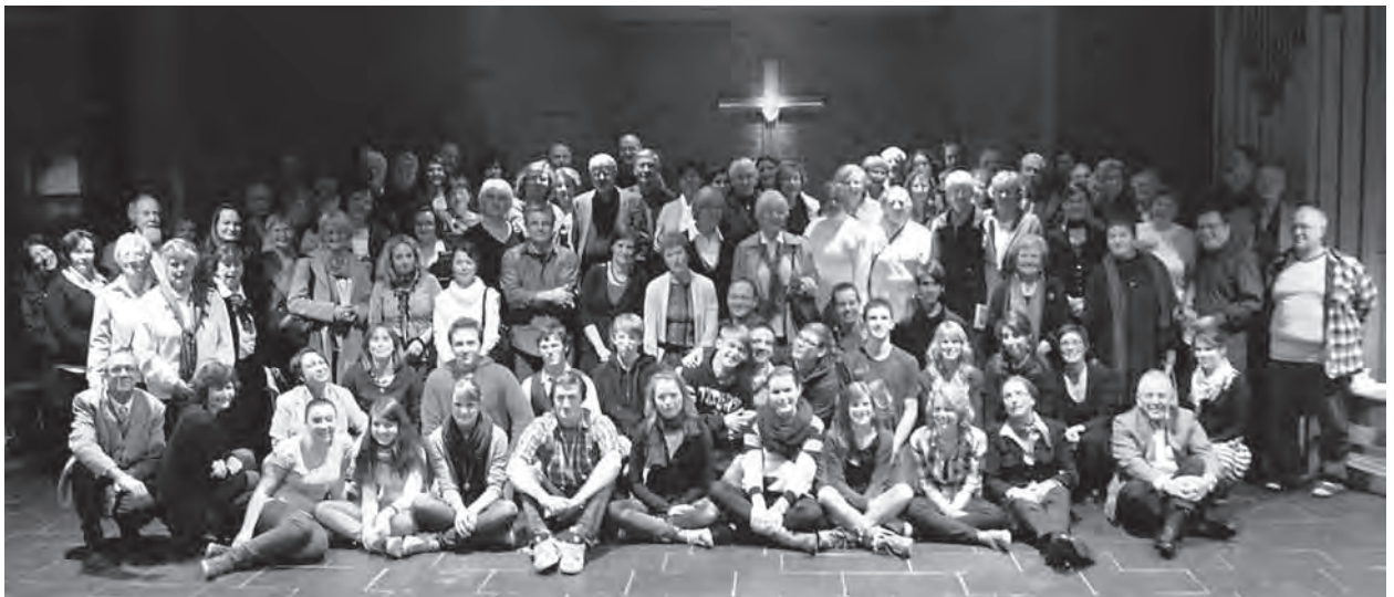
Ehrenamtliches Engagement in der Gemeinde – Viele sind dabei!