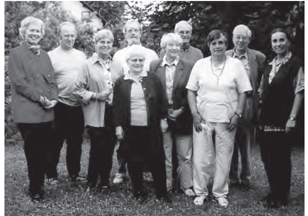
Die Stützen des Diakonievereins TTT