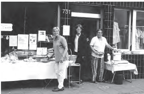
Das heutige Domizil von TTT